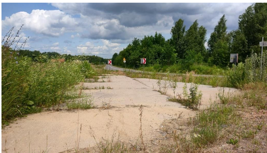
Rysunek 12 Pozostałości betonowej drogi wybudowanej w czasie II Wojny Światowej w okolicy Chruślic

Teren, na którym znajdują się Chruślice, był w czasie II Wojny Światowej objęty obozem wojskowym. Istniał tu obóz pracy przymusowej dla obywateli różnych narodowości – Polaków, Rosjan i Żydów. Do dziś pozostały wokół betonowe drogi wybudowane przez więźniów na polecenie okupanta. Pamięć o tamtych wydarzeniach jest wciąż żywa, choć niejawna. Starsi pamiętający tamte straszne czasy nie chcą dzielić się traumatycznymi wspomnieniami. Od kilku lat natomiast, przez przedstawicieli kolejnego pokolenia, podejmowane są różnorodne inicjatywy, które mają na celu przywrócenie pamięci o przeszłych wydarzeniach. Zrewitalizowano cmentarz, miejsce pochówku kilku tysięcy Polaków Żydów i Rosjan zamęczonych i straconych w obozie. To miejsce spotkania i refleksji nad ogromem cierpienia, którego doświadczyli wszyscy bez względu na narodowość czy przynależność religijną. Umieszczone obok siebie trzy symbole – Krzyż Rzymskokatolicki, Krzyż Prawosławny i Gwiazda Dawida to symbol wspólnoty ludzkiej zjednoczonej w obliczu tragedii.