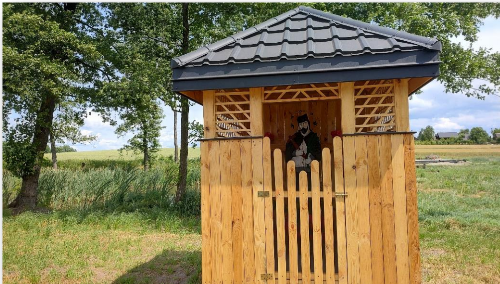
Rysunek 8 Odnowiona kapliczka św. Jana Nepomucena w Chruślicach

Ta długa i imponująca lista to niektóre i największe inicjatywy i przedsięwzięcia podejmowane przez mieszkańców Chruślic na rzecz wspólnego dobra w ostatnich latach. Należy zauważyć, że większość z nich mogła zaistnieć, ponieważ ogrom pracy przy ich realizacji przejęli na siebie mieszkańcy w ramach czynów społecznych. Godziny pisania wniosków, organizacji wydarzeń, zakupu materiałów, realizacji działań i rozliczania dotacji to kapitał, który stanowi o rozwoju Chruślic. To koszty najczęściej nigdzie nie ujmowane i nie mające ekwiwalentu w budżetach projektów, zwiększające wartość wszystkich projektów.