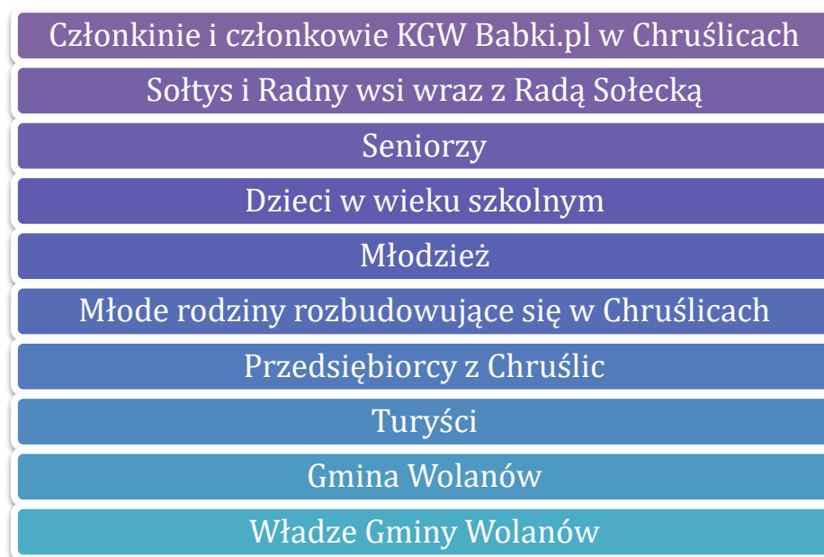
Rysunek 1 Interesariusze Koncepcji Inteligentnej Wsi dla miejscowości Chruślice

Szczegółowo zaplanowano proces tworzenia koncepcji. W pierwszym kroku dokonano ustalenia jej interesariuszy. Dzięki temu zadbano, aby byli obecni na różnorodnych etapach przygotowywania dokumentu. Wskazano następujące grupy i osoby: