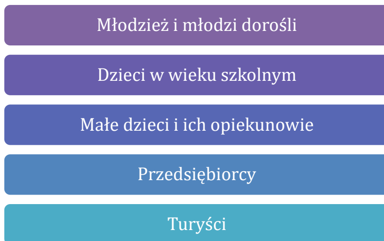
Rysunek 2 Grupy docelowe Koncepcji Inteligentnej Wsi dla miejscowości Chruślice

Określono także grupy docelowe, które zostaną objęte dedykowanymi działaniami w ramach koncepcji. Są to: