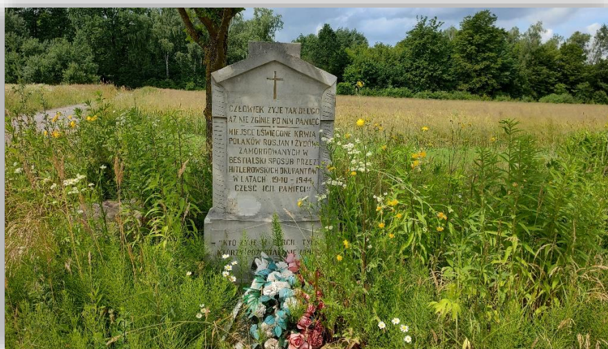
Rysunek 6 Pomnik upamiętniający ofiary II Wojny Światowej

Od roku 1941 do 1944, w niedalekiej odległości od Chruślic powstał obóz lotniczy wojsk niemieckich. Równocześnie do budowy i obsługi bazy wykorzystywano niewolniczą pracę osób będących jeńcami Obozu Pracy Przymusowej. W wyniku nadludzkiego wysiłku, niedożywienia i złych warunków socjalnych, śmierć poniosło wielu więźniów. Ponad 3000 osób narodowości Polskiej, Rosyjskiej i Żydowskiej jest pochowanych na cmentarzu w Chruślicach.