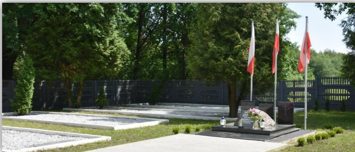
Rysunek 7 Cmentarz Wojenny w Chruślicach