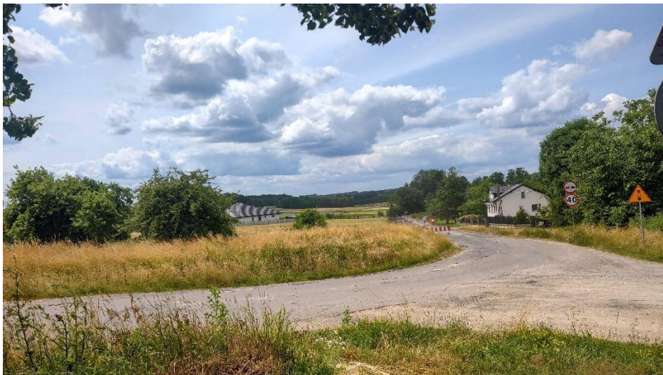
Rysunek 14 Malownicza panorama rozciągająca się spod Lokalnego Centrum Rekreacji w Chruślicach

jest bardzo malownicza. Ścieżki będą pośród bujnej przyrody i wystarczy wspiąć się na niewielkie wzniesienia wokół, aby przed oczami roztoczył się piękny widok. Sprzyja to uprawianiu aktywnej turystyki i rekreacji w postaci spacerów, Nordic Walking czy wycieczek rowerowych. Dzięki temu mieszkańcy mogą praktykować ruch na świeżym powietrzu, co przeciwdziała wielu chorobom i trudnościom zdrowotnym.