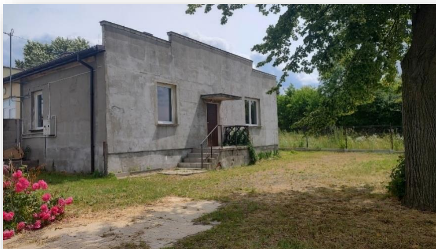
Rysunek 4 Lokalne Centrum Rekreacji w Chruślicach - siedziba KGW Babki.pl