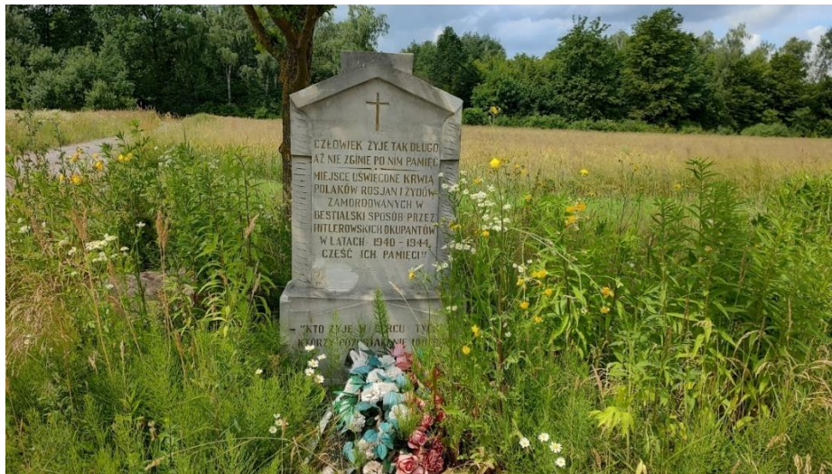
Rysunek 13 Pomnik upamiętniający poległych w czasie II Wojny Światowej

Remont Cmentarza ofiar II Wojny Światowej został dofinansowany przez Wojewodę Mazowieckiego. Utworzono tu „Aleję Poległych”, odnowiono pomnik ofiar zbiorowych mordów, wykonano 3 tablice z symbolami religijnymi oraz tablicę upamiętniającą zabitych i pomordowanych. Zamontowano 3 maszty flagowe oraz zrewitalizowano groby, teren i ogrodzenie cmentarza.