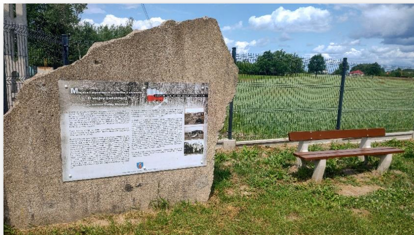
Rysunek 5 Kamień upamiętniający wydarzenia z czasów II Wojny Światowej w Gminie Wolanów