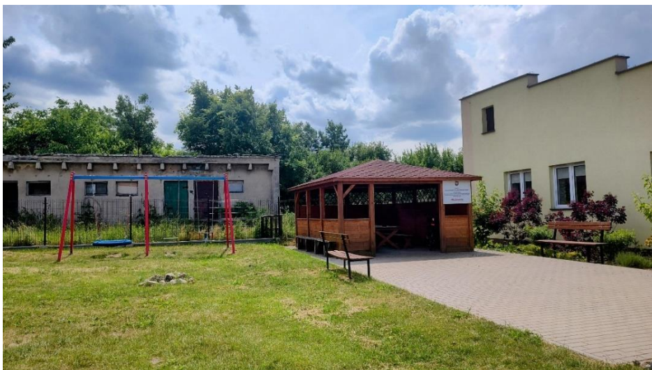
Rysunek 10 Teren rekreacyjny przy Klubie Senior+ w Chruślicach

Obok budynku znajduje się teren, na którym zlokalizowano niewielki plac zabaw. Jest tam również zadaszona altana. Na realizację tego przedsięwzięcia sołectwo Chruślice otrzymało dofinansowanie z budżetu Gminy Wolanów oraz ze środków Mazowieckiego Instrumentu Aktywizacji Sołectw. Za realizację tego projektu zostało wyróżnione przez Marszałka Województwa nagrodą pieniężną w konkursie na najlepszą inicjatywę. W uzasadnieniu kapituły wskazano, że stało się to dzięki istotnemu wkładowi pracy własnej mieszkańców. Po raz kolejny okazało się, że wkład pracy mieszkańców przynosi realne korzyści finansowe. Mieszkańcy mogą zrealizować więcej inicjatyw biorąc na siebie ciężar pracy wolontariackiej.