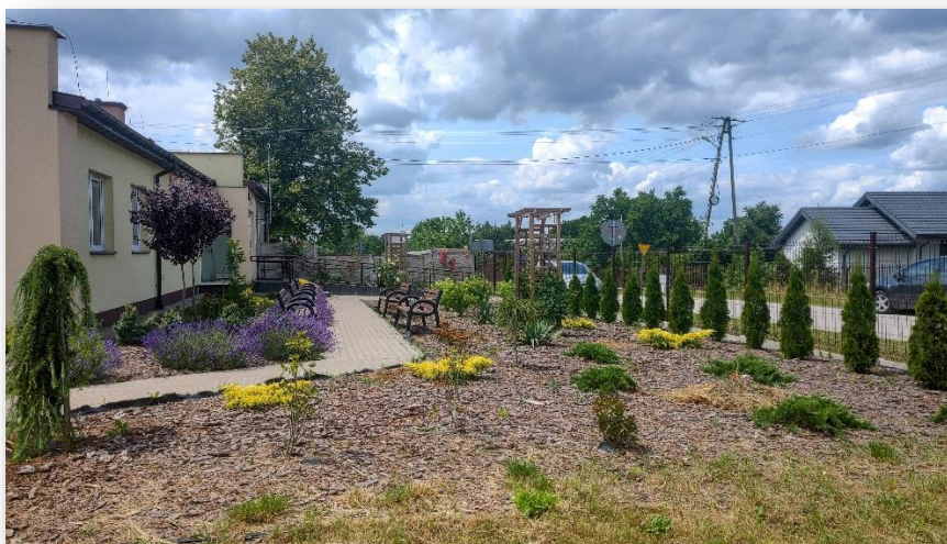
Rysunek 3 Zagospodarowany teren wokół Klubu Senior+ w Chruślicach

aktywności społecznej i wzmocnienia więzi z miejscem zamieszkania. Istotą projektu było również pobudzenie aktywności wśród mieszkańców oraz zwiększenie atrakcyjności obszaru wsi Chruślice. Urządzony plac rekreacyjny jest miejscem wielu spotkań zarówno dla dorosłych jak i młodzieży z naszej miejscowości, ale również dla mieszkańców pobliskich miejscowości. Jest to miejsce spotkań naszych dziadków, rodziców, seniorów korzystających z tego miejsca w dzień oraz miejscowej młodzieży w porze popołudniowej i wieczornej czy członkiń KGW.