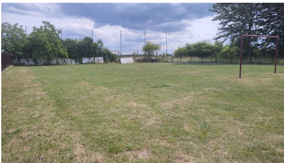
Rysunek 11 Boisko sportowe w Chruślicach

W dalszej części terenu młodzież urządziła prowizoryczne boisko. Ich marzeniem jest, aby obszar ten został wyremontowany i powstał dobrej jakości i wyposażony teren sportowy.