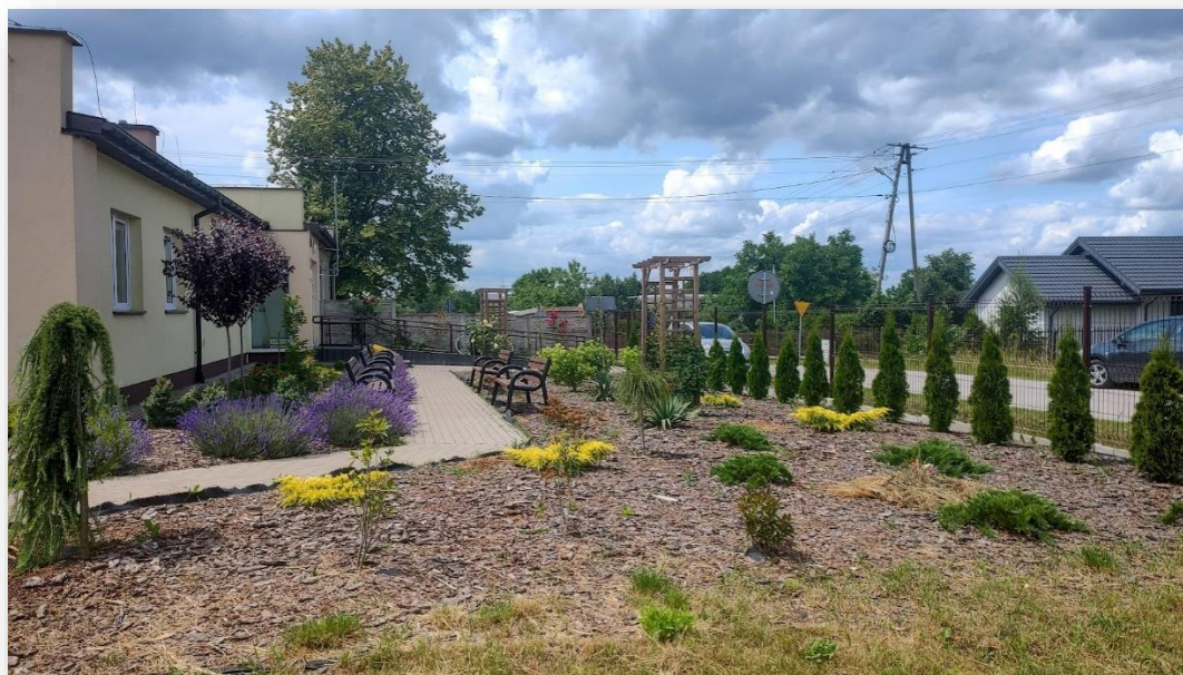
Rysunek 9 Zagospodarowany teren wokół Klubu Senior+ w Chruślicach

własnych KGW, jest wykorzystywana przez Koło Gospodyń Wiejskich. Dzięki dofinansowaniu z budżetu Samorządu Województwa, udało się Paniom wyposażyć kuchnię. Kolejne dofinansowanie, niedawno przyznane, tym razem z LGD Razem dla Radomki, poświęcone jest termomodernizacji budynku i wykonaniu elewacji. Projekt ten, dofinansowany w 100% ze środków unijnych w ramach programu LEADER, będzie realizowany w najbliższym czasie.